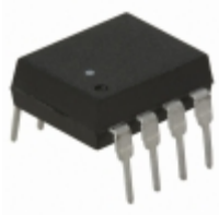
HCNW136-000E Broadcom Limited OPTOISOLATOR 5KV TRANS 8DIP