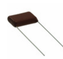
ECQ-E2684RKF Panasonic Electronic Components CAP FILM 0.68UF 10% 250VDC RAD