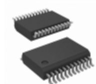
ICL3207ECAZ-T Intersil IC 5DRVR/3RCVR RS232 3V 24-SSOP