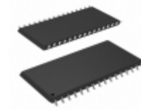
CY7C1019CV33-15ZXI Cypress Semiconductor Corp IC SRAM 1MBIT 15NS 32TSOP