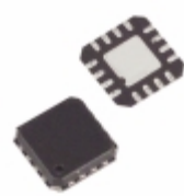
MAX4781EGE+T Maxim Integrated IC MULTIPLEXER 8X1 16QFN