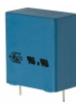
B32923C3225M000 EPCOS CAP FILM 2.2UF 20% 305VAC RADIAL