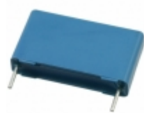
B32923C3334K EPCOS (TDK) CAP FILM 0.33UF 10% 305VAC RAD