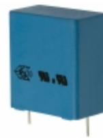
B32923C3225K000 EPCOS CAP FILM 2.2UF 10% 305VAC RADIAL