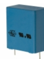
B32923C3225M EPCOS (TDK) CAP FILM 2.2UF 20% 305VAC RADIAL