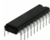
MCHC705J7CPE NXP USA Inc. IC MCU 8BIT 6KB OTP 20DIP