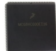
MCHC711KS2CFNE4 NXP USA Inc. IC MCU 8BIT 32KB OTP 68PLCC