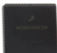
MCHC711KS2MFNE4 NXP USA Inc. IC MCU 8BIT 32KB OTP 68PLCC