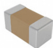
C0603C102K5JAC7867 KEMET CAP CER 1000PF 50V U2J 0603