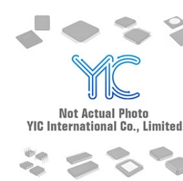
CAT5261JI-00 CAT CAT5261JI-00 CAT