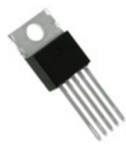
MCP1827-1202E/AT Microchip Technology IC REG LDO 1.2V 1.5A TO220-5