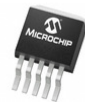
MCP1827-0802E/ET Microchip Technology IC REG LDO 0.8V 1.5A DDPACK