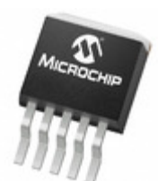
MCP1827-1202E/ET Microchip Technology IC REG LDO 1.2V 1.5A DDPACK