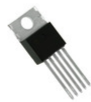
MCP1827-1802E/AT Microchip Technology IC REG LDO 1.8V 1.5A TO220-5