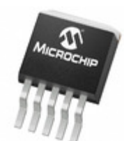
MCP1827-1802E/ET Microchip Technology IC REG LDO 1.8V 1.5A DDPACK