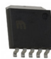
MIC37252WR Microchip Technology IC REG LDO ADJ 2.5A SPAK-5