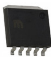
MIC37252WR-TR Microchip Technology IC REG LDO ADJ 2.5A SPAK-5