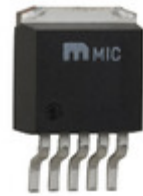
MIC37252WU-TR Microchip Technology IC REG LDO ADJ 2.5A TO263-5