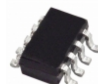
ADG3249BRJ-R2 Analog Devices Inc. IC MUX/DEMUX 2X1 SOT23-8