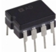
AD829AQ Analog Devices Inc. IC VIDEO OPAMP HS LN 8-CDIP