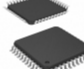
ATF1504ASVL-20AC44 Microchip Technology IC CPLD 64MC 20NS 44TQFP