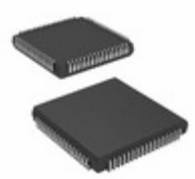
ATF1504ASVL-20JC68 Microchip Technology IC CPLD 64MC 20NS 68PLCC