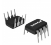
ISL83490IP Intersil IC TXRX RS485/422 3.3V LP 8-D