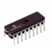
PIC16C620A/JW Microchip Technology IC MCU 8BIT 896B EPROM 18CERDIP