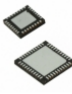
ATMEGA644PR231-MU Microchip Technology IC RF TXRX+MCU 802.15.4/ISM