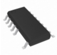
LYT3328D Power Integrations IC LED DVR DIM 20.4W 1-ST 16SOIC