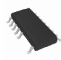
LYT3326D-TL Power Integrations IC LED DVR DIM 12.6W 1-ST 16SOIC