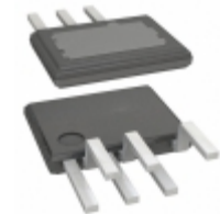
LYT4212E2 Power Integrations IC LED DRIVER OFFL 2.08A ESIP-7C