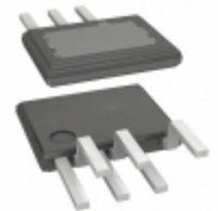
LYT4211E2 Power Integrations IC LED DRIVER OFFL 1.37A 7- ESIP