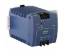
ML95.100 PULS DIN RAIL PWR SUPPLY 95W 24 3.9A