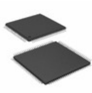
PIC24FJ128GB110-I/PF Microchip Technology IC MCU 16BIT 128KB FLASH 100TQFP