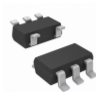
TC6501P120VCTTRG Microchip Technology IC TEMP SWITCH OPEN-DRN SOT23-5