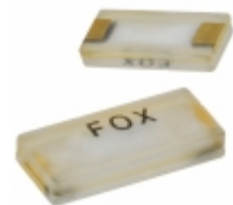
FC8AQCCMM4.0-T1 Fox Electronics CRYSTAL 4.0000MHZ 20PF SMD