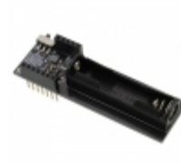
RFD22127 RF Digital RFDUINO SINGLE AAA SHIELD