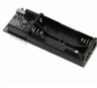
RFD22126 RF Digital RFDUINO DUAL AAA SHIELD