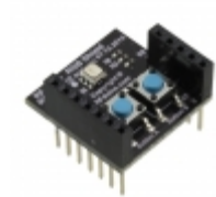
RFD22122 RF Digital RFDUINO RGB SHIELD