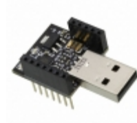
RFD22121 RF Digital RFDUINO USB SHIELD