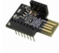
RFD22124 RF Digital RFDUINO PCB USB SHIELD