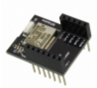
RFD22102 RF Digital Corporation RF TXRX MOD BLUETOOTH CHIP ANT