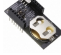
RFD22128 RF Digital RFDUINO CR2032 SHIELD