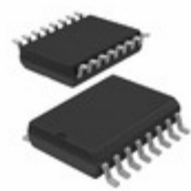
A3968SLBTR Allegro MicroSystems, LLC IC MOTOR DRIVER PAR 16SOIC