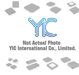
MMJT9435T1G/MMJT9410 ON MMJT9435T1G/MMJT9410 ON