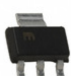
MIC5239-1.8YS Microchip Technology IC REG LDO 1.8V 0.5A SOT223