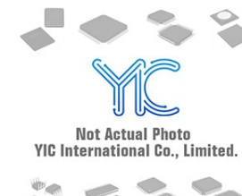
MIC5239-2.5WS Micrel Micrel SOT-223