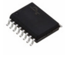
S25FL032P0XMFB000 Cypress Semiconductor Corp IC FLASH 32MBIT 104MHZ 16SOIC