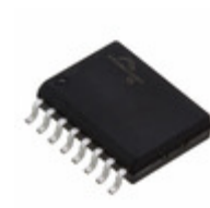
S25FL032P0XMF1000 Cypress Semiconductor Corp IC FLASH 32MBIT 104MHZ 16SOIC