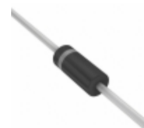
P6KE13A ON Semiconductor TVS DIODE 11.1VWM 18.2VC AXIAL