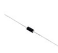
P6KE13A-B Littelfuse Inc. TVS DIODE 11.1VWM 18.2VC AXIAL