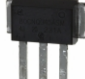
80CNQ040ASM Electro-Films (EFI) / Vishay DIODE ARRAY SCHOTTKY 40V D618SM