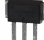
80CNQ040ASM Vishay Semiconductor Diodes Division DIODE ARRAY SCHOTTKY 40V D618SM