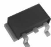
80CNQ035SL SMC Diode Solutions DIODE SCHOTTKY 35V 40A PRM2-SL