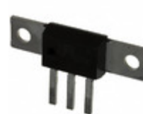
80CNQ040A Electro-Films (EFI) / Vishay DIODE ARRAY SCHOTTKY 40V D618