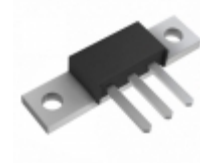
80CNQ040 SMC Diode Solutions DIODE SCHOTTKY 40V 40A PRM2 D618SM