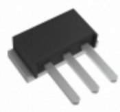
80CNQ035SM SMC Diode Solutions DIODE SCHOTTKY 35V 40A PRM2-SM