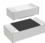
CR0603-JW-913ELF Bourns Inc. RES SMD 91K OHM 5% 1/10W 0603