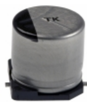
EEE-TK1C222AM Panasonic Electronic Components CAP ALUM 2200UF 20% 16V SMD