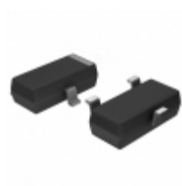
KSC3123RMTF Fairchild/ON Semiconductor TRANSISTOR NPN 20V 50MA SOT-23