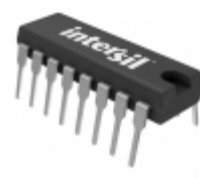
HI3-0201-5 Intersil IC SWITCH QUAD SPST 16DIP