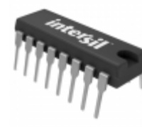
HI3-0201-5Z Intersil IC SWITCH QUAD SPST 16DIP