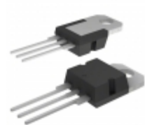
MIC29710-5.0BT Microchip Technology IC REG LDO 7.5A 5V TO220-3