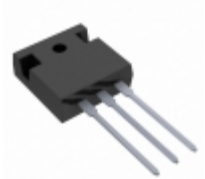
MIC29750-3.3BWT Microchip Technology IC REG LDO 3.3V 7.5A TO247-3