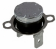
CS710015Z Cantherm THERMOSTAT 100 DEG C N/O FASTON