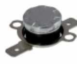
CS710015Y Cantherm THERMOSTAT 100 DEG C NO FASTON