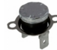
CS709525Z Cantherm THERMOSTAT 95 DEG C N/C FASTON