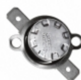
CS710025Y Cantherm THERMOSTAT 100 DEG C NC FASTON