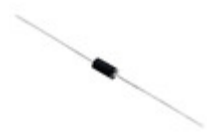
P6KE91C-B Littelfuse Inc. TVS DIODE 77.8VWM 131.25VC AXIAL