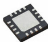
MPR083Q NXP USA Inc. IC CTRL TOUCH SENSOR PROX 16-QFN