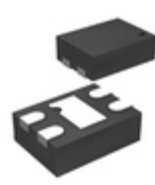
MIC5337-2.8YMT-TR Microchip Technology IC REG LDO 2.8V 0.3A 4TMLF