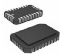
STK11C68-5L45M Cypress Semiconductor Corp IC NVSRAM 64KBIT 45NS 28LCC