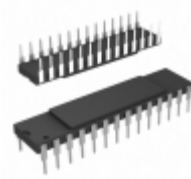
STK11C68-5K45M Cypress Semiconductor Corp IC NVSRAM 64KBIT 45NS 28CDIP