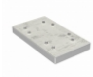
M95M02-DRCS6TP/K STMicroelectronics IC EEPROM 2MBIT 5MHZ 8WLCSP