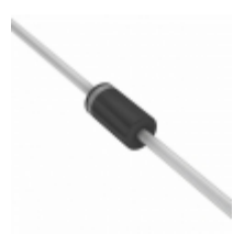
BZX85C11-TR Electro-Films (EFI) / Vishay DIODE ZENER 11V 1.3W DO41