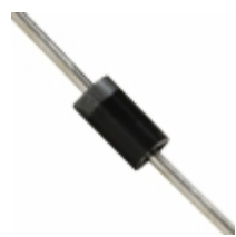
BZX85C11_T50R Fairchild/ON Semiconductor DIODE ZENER 11V 1W DO41