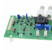
AD8556CP-EBZ ADI (Analog Devices, Inc.) EVAL BOARD AD8556