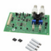
AD8556-EVALZ ADI (Analog Devices, Inc.) EVAL BOARD OPAMP CHOPPER AD8556