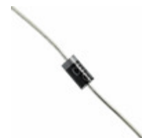
1N4742A TR Central Semiconductor Corp DIODE ZENER 12V 1W DO41