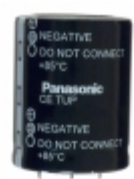
ECE-T2DP272FA Panasonic Electronic Components CAP ALUM 2700UF 20% 200V SNAP