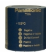
ECE-T2EA122EA Panasonic Electronic Components CAP ALUM 1200UF 20% 250V SNAP