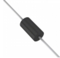
P6KE220CA STMicroelectronics TVS DIODE 188VWM 388VC