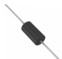
P6KE220CA-B Diodes Incorporated TVS DIODE 185VWM 328VC DO15