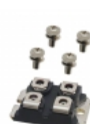
APT30F60J Microsemi Corporation MOSFET N-CH 600V 31A SOT-227