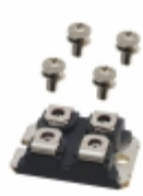
APT30GF60JU3 Microsemi Corporation IGBT 600V 58A 192W SOT227