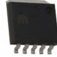
MIC37301-1.5WR-TR Microchip Technology IC REG LDO 1.5V 3A SPAK-5