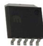
MIC37301-1.65BR Microchip Technology IC REG LDO 1.65V 3A SPAK-5