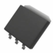
MIC37300-3.3WR-TR Microchip Technology IC REG LDO 3.3V 3A SPAK-3