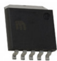
MIC37301-1.5BR Microchip Technology IC REG LDO 1.5V 3A SPAK-5