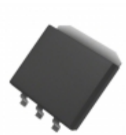
MIC37300-3.3BR TR Microchip Technology IC REG LDO 3.3V 3A SPAK-3