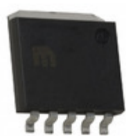
MIC37301-1.65BR TR Microchip Technology IC REG LDO 1.65V 3A SPAK-5