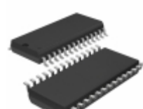
LTC1419CSW#TRPBF Linear Technology IC A/D CONV 14BIT SAMPLNG 28SOIC