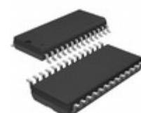
LTC1419CSW#TRPBF ADI (Analog Devices, Inc.) IC A/D CONV 14BIT SAMPLNG 28SOIC