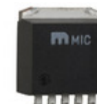
MIC5209-3.3BU TR Microchip Technology IC REG LDO 3.3V 0.5A TO263-5