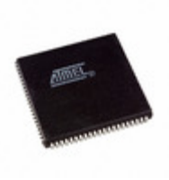
AT40K10LV-3AJC Microchip Technology IC FPGA 3.3V 576 CELL 84-PLCC