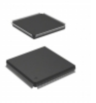
AT40K10AL-1DQC Microchip Technology IC FPGA 10K GATES 208QFP