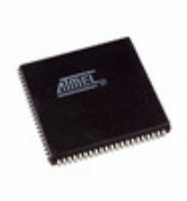
AT40K10LV-3AJI Microchip Technology IC FPGA 3.3V 576 CELL 84-PLCC