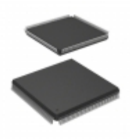
AT40K10AL-1EQC Microchip Technology IC FPGA 10K GATES 240QFP